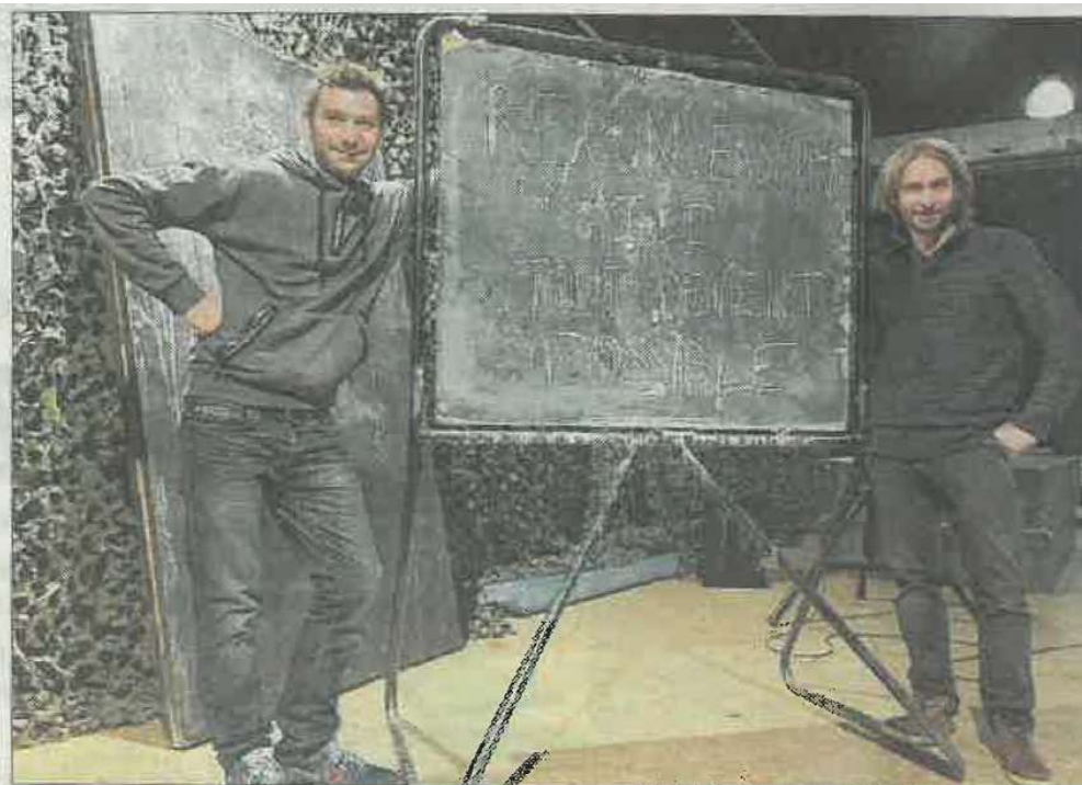
Avec A.W.A.C., tout est possible !

L'ironie, grâce au détournement des codes et de l'esprit très « win-win » des adeptes de la reconversion professionnelle, promet également d'être au rendez-vous. En espérant qu'A.W.A.C fasse un jour escale dans le Pays de Montbéliard.