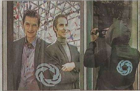
Des rendez-vous toute la semaine dans la rue commerçante.

tiers périphériques pendant une semaine. Collecte de témoignages, vidéos, micro-trottoirs, mises en scène... Ils vont ainsi sensibiliser les Villefranchois à ce problème de la reconversion et conclure ces quelques jours par des restitutions ouvertes à tous. L'expérience a déjà été menée à Decazeville, à Villecomtal, à Sauveterre avec succès. Une expérience innovante de théâtre utopique tout public à vivre dans le centre-ville de Villefranche. La Cie est à votre disposition dans le local commercial situé au 38, rue de la République à Villefranche, local prêté gracieusement par son propriétaire pour la réalisation de ce projet. Les artistes seront ravis de vous accueillir