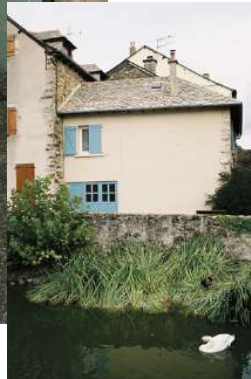
À quelques pas des anciennes douves de la bastide royale, on se presse à la salle du Four Banal.