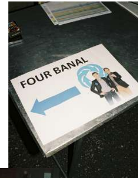
Cela faisait longtemps qu'au village on n'avait plus joué à guichet fermé. Pour Reconversion , une seconde représentation a même été ajoutée !