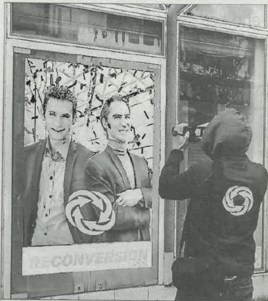
Des rendez-vous toute la semaine dans la rue commerçante.

La saison se poursuit pour les Espaces Culturels. Durant une semaine, jusqu'à ce samedi 21 octobre, la compagnie a pris ses quartiers au 38 rue de la République. Si les artistes ne proposent pas un spectacle théâtral conforme à ceux qu'ils ont l'habitude de programmer, c'est une expérience culturelle participative, qui est mise en place par la compagnie. Le titre « Reconversion » évoque le devenir de nos petites villes qui espèrent retrouver l'animation qui fut la leur pendant des décennies. Installés dans un lieu délaissé de notre ville auquel ils vont redonner vie, deux artistes, joyeux lurons, vont rayonner dans les rues du centre-ville et les quartiers périphériques pendant une semaine. Collecte de témoignages, vidéos, micro-trottoirs, mises en scène... Ils vont ainsi sensibiliser les Villefranchois à ce problème de la reconversion